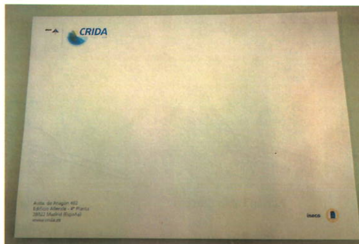
Ilustración 6. Ejemplo sobre grande