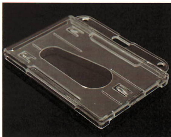
Ilustración 4. Ejemplo porta-tarjetas