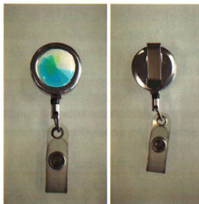
Ilustración 3. Ejemplo identificador yoyo metálico con logo de CRIDA

A modo de ejemplo, se incluyen las Ilustración 3 e Ilustración 4.