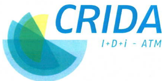
Ilustración 1. Logotipo CRIDA.

Por su parte, el diseño de aquellos productos que no forman parte del manual deberán incluir el logotipo de CRIDA (Ilustración 1) y, opcionalmente, el logotipo de sus partners (Ilustración 2). En estos casos, se valorarán positivamente los diseños originales.