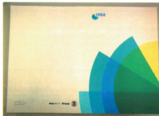
Ilustración 5. Ejemplo carpeta vista por fuera desdoblada