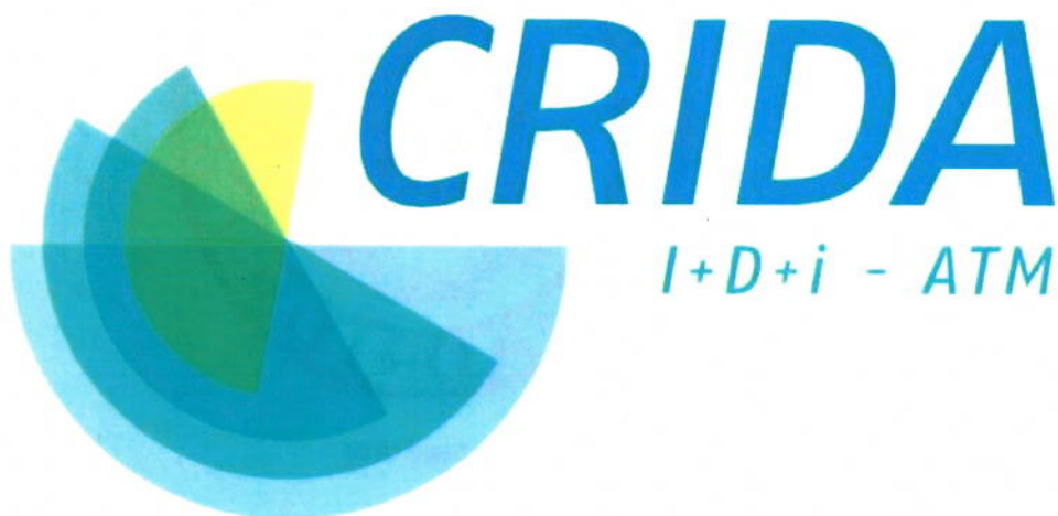
Ilustración 1 Logo CRIDA

A continuación, y con el fin de disponer de los medios necesarios para proponer diseños y estimar costes de producción, se presentan los logotipos de CRIDA y sus socios: